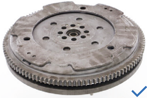
Komplettes Teil ohne fehlende Teile oder Beschädigungen