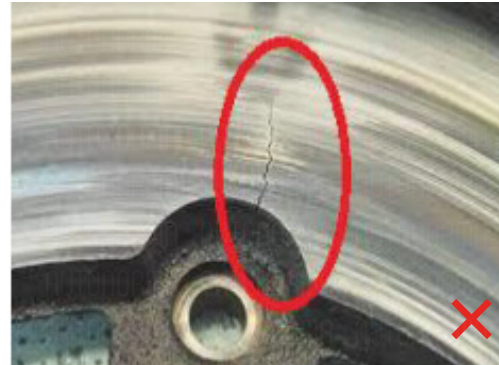
Rissige Oberfläche des Teils